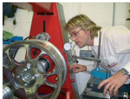
Neue Richtanlage zur Rundlaufinstandsetzung.

rechtzeitig zur Wintersaison 2009/10 steht eine weitere prozessgesteuerte KSP-3-Schleifmaschine und Felgen-Polieranlage zur Verfügung. Diese ermöglichen, so Andreas Kurz, beste Verarbeitungen im Detail an der Felge, kürzere Bearbeitungszeiten in der Werkstatt sowie schnellere Lieferzeiten für den Kunden. Ob Matt, Seidenglanz, Hochglanz oder Spiegelglanz – der Händler oder Kunde bestimmt den gewünschten Glanzgrad und Finish. Lackieren und Beschichten sei eine