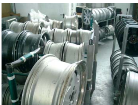
Jede Felge wird vor der Reparatur vermessen.